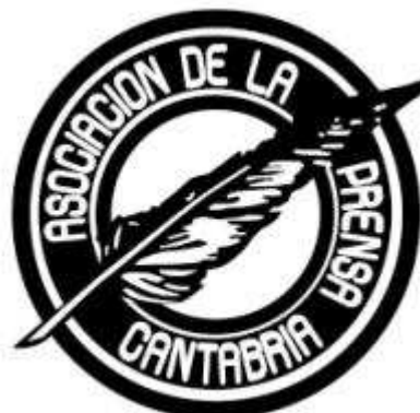
Logotipo de la Asociación de la Prensa de Cantabria (APC)

La Asociación ha entendido que la Comunicación de Crisis puede ser un tema de gran interés, pues es noticia permanente en los medios en este tiempo. Se pretende abordarla desde el punto de vista de la comunicación en los planos económico-empresarial e institucional de las administraciones públicas. Todo ello, con claves para su gestión y papel del portavoz.