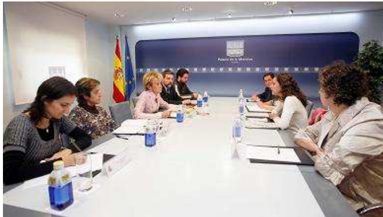
Momento de la reunión entre representantes de la FAPE y de la Vicepresidencia del Gobierno

Haciéndose eco del sentir generalizado de sus 48 asociaciones federadas, FAPE también trasladó al Gobierno la intranquilidad del sector ante "las secuelas que la crisis dejará en la profesión". "La democracia", insistió la presidenta de FAPE, "requiere una información fiable como un bien público. Esto implica que necesitamos gente y recursos para producirlo y ponerlo en circulación. El periodismo y sus profesionales deben ser protegidos y animados a desarrollarse".