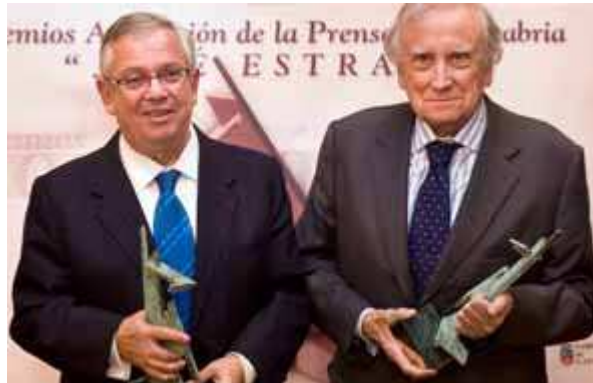
Los premiados posaron junto con los galardones