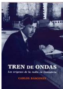
Portada del libro 'Tren de Ondas'

Se trata de un trabajo de investigación sobre el nacimiento de la radio en Santander, en el año 1933. La publicación incluye, además, un CD que contiene tres elementos que, según Báscones, "son de gran interés".