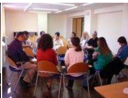
Los alumnos se distribuyeron en grupos para realizar la práctica final del curso